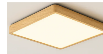
LUMINÁRIA DE TETO QUADRADA 30X30