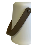
LUMINÁRIA DE MESA